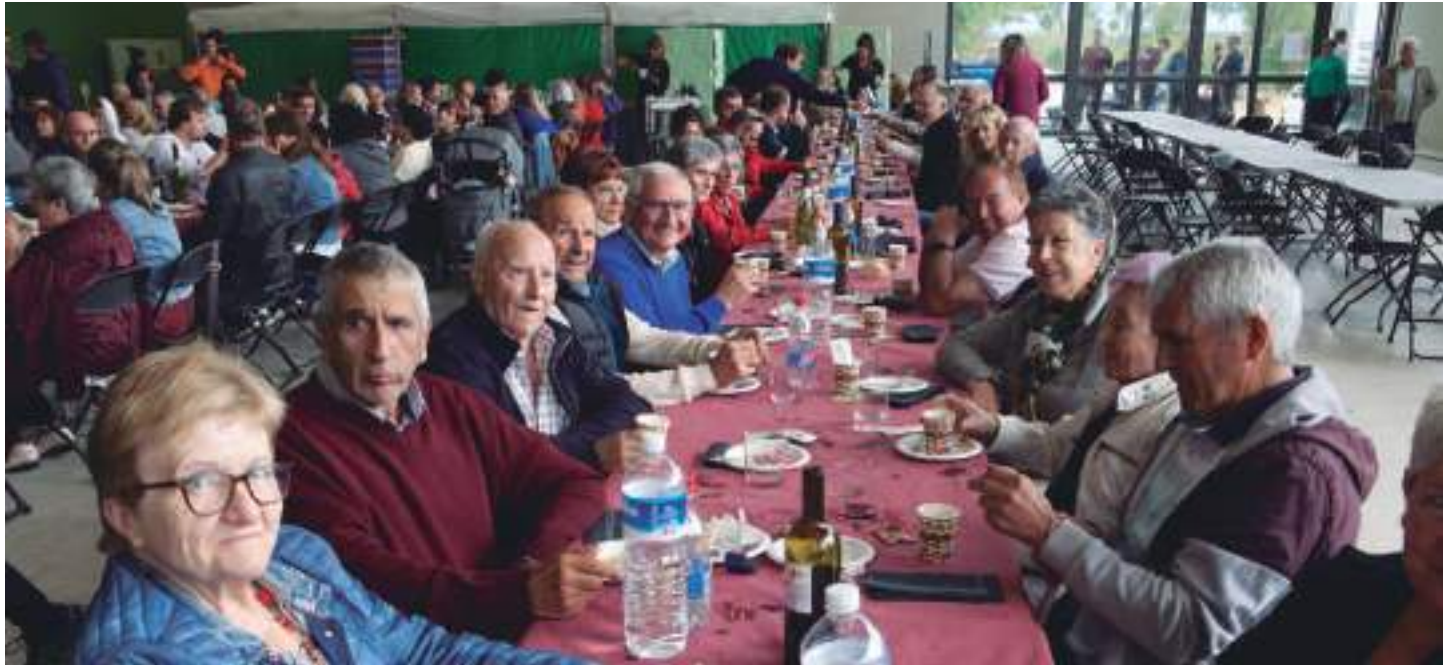
RIOPLANO INFORMA / BERRIOBEITIKO AHOTSA