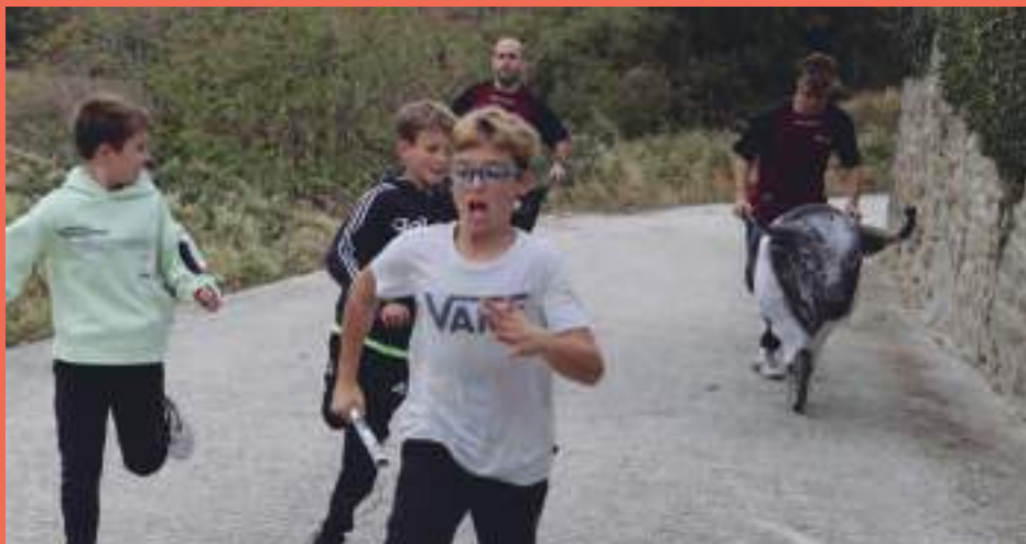
Zendearen eguna :: Día de la cendea