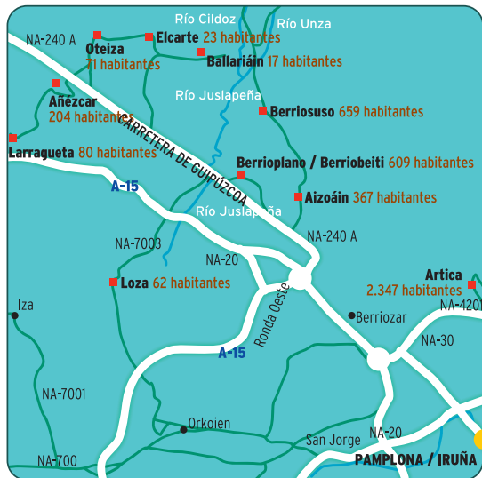
NÚMERO DE HABITANTES EN CADA LOCALIDAD (28 DE FEBRERO 2009)