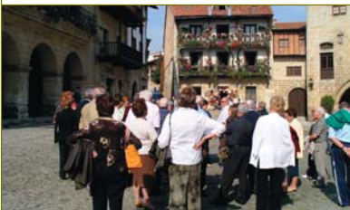
RECIENTE VIAJE A SANTILLANA DEL MAR.

LAGUNTZAK. 15.000 euro bi talderendako. Udalak 15.000 euro eman dizkie guztira, kultur, kirol eta gazte jardueretarako diru-laguntzen deialdira aurkeztutako bi talderi: 13.313 euro jasoko ditu hezitzaile batek, guraso talde baten izenean, hiri kanpalditarako; 1.687 euro lortu ditu Berriobeiti Kultur Elkarteak, bere jarduerara gartzeko.