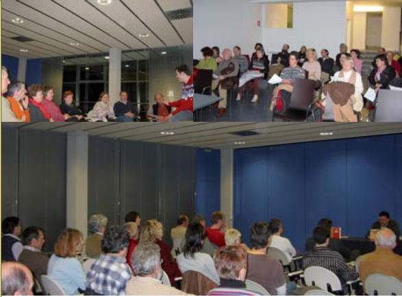
CHARLAS SOBRE CARNAVAL, MUJER Y SOBERANÍA