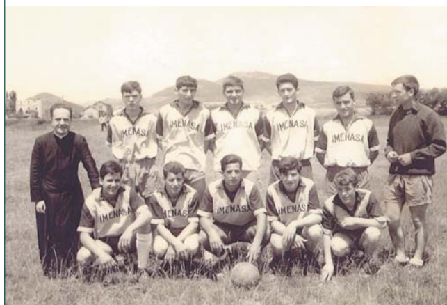
RETROSPECTIVAS ATZERA BEGIRAKOAK. FIESTA DE LA JUVENTUD (1966). El deporte también tuvo cabida en la Fiesta de la Juventud de la Cendea de Ansoáin y del Valle de Juslapeña de 1966. En la imagen que publicamos aparecen jóvenes de Aizoáin, Berriozar, Berrioplano, Berriosuso y Loza junto al entonces párrroco de Berriozar.

ARTICA Paleta goma y frontón. ☎ 630 238685 Alquiler a residentes y nacidos en el concejo: 3 euros/hora. Vecinos junto a no vecinos: 6 euros/hora. Dos horas: 4 euros más luz. No vecinos: 12 euros/hora. Dos horas: 20 euros más luz Fichas de luz: 3 euros/hora. Ducha opcional: 2,4 euros. Horario: de lunes a viernes, de 8:00 a 22:00 horas. Sábado: de 9:00 a 21:00 horas. Domingo: cerrado.