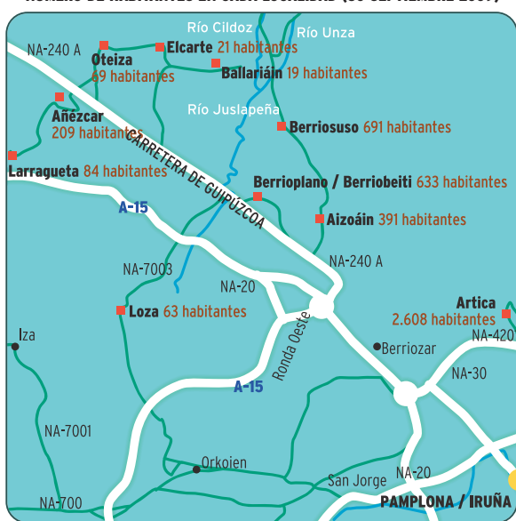
NÚMERO DE HABITANTES EN CADA LOCALIDAD (30 SEPTIEMBRE 2009)