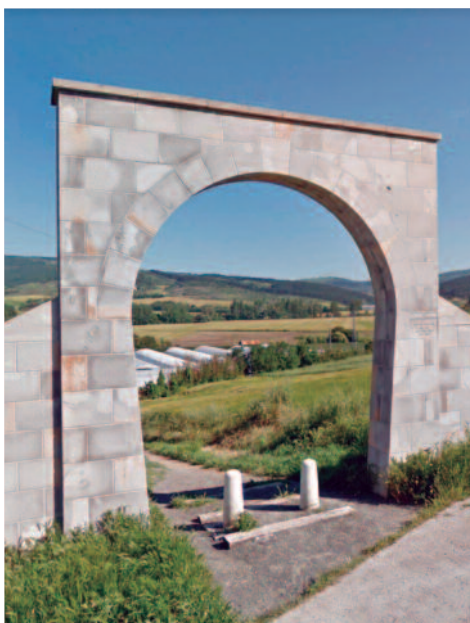
Monumento al tren del Plazaola

En un artículo publicado en Diario de Navarra en 1914, el cronista describe el trayecto y cita a la estación de Aizoáin y del barrio de Oronsospe: “Sale el tren del Empalme. Vamos viendo: Artica y Berriozar á la derecha, y estación de Ainzoin á la izquierda... Salimos de Ainzoin; pasa a nivel de la carretera de Ulzama; quedan Oronsepe a la derecha y Berrioplano a la izquierda. Túnel de Berriosuso, por debajo del pueblo, de 220 metros. A la derecha se ve un pueblo minúsculo, de 6 casas: Ballariain...”.